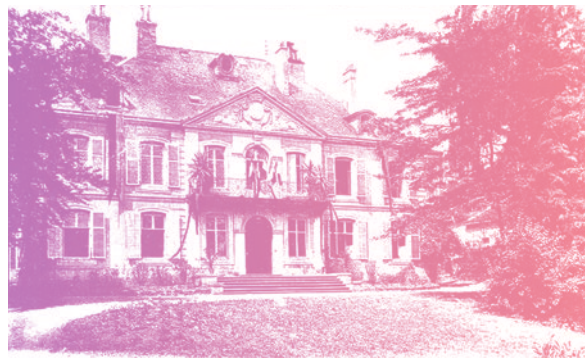
Foyer des Jeunes Ouvriers, MAXÉVILLE (M.-et-M.). - Le Château (autrefois dit du Grand Sauvoy)